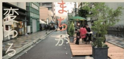
近畿大学学生によるしんいづか商店街デザイン実験