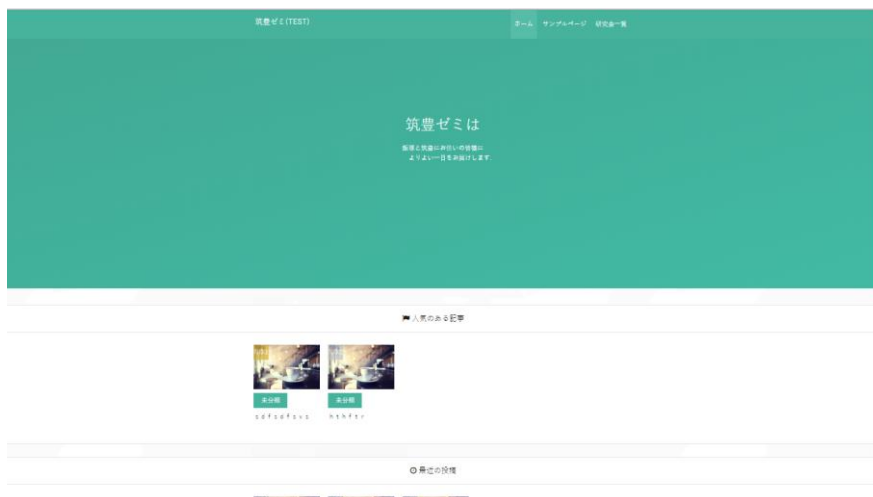
画像 1 トップページ-1 枚目

現在、筑豊ゼミのホームページをリニューアルするために WordPress でテスト環境を構築して、プロトタイプモデルを作成中です。