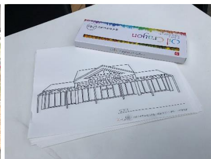
特製ぬりえも登場！