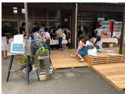
デッキを重ねることでイスとなる提案