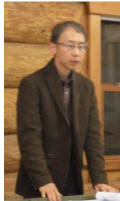
このままで委員会縄田さん