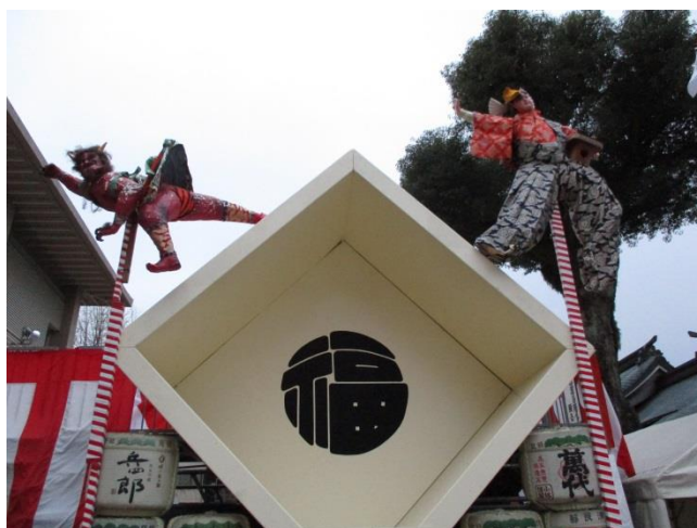
博多櫛田神社 節分会