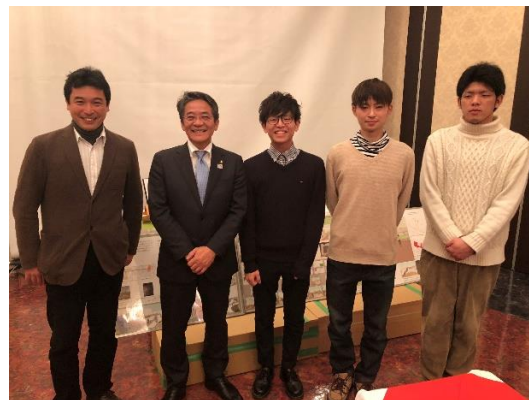
片峰市長と発表会場にて