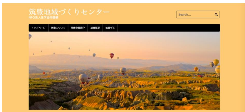
(図2 トップページへのテストページ)

最終的にWebページのテーマを「Coral Light」というものに決定しました。まだまだ完成には程遠いですが、テーマに沿ってレイアウトや配色なども議論している最中です。(図2, 図3)