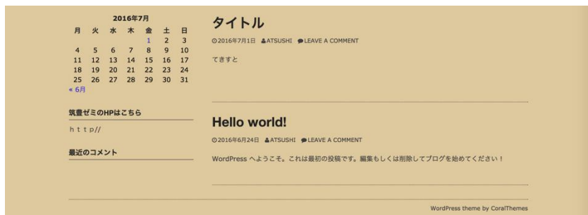
(図3 コンテンツ内容のテストページ)