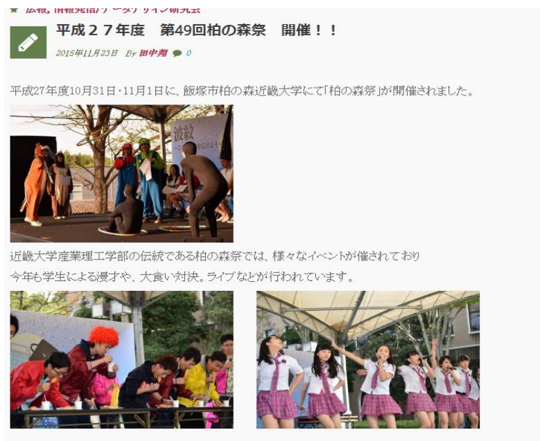
図 2. 柏の森祭の特集ページ

また近畿大学の「柏の森祭」が 11 月に催されたので、取材して Web ページに掲載しました。(図 2)