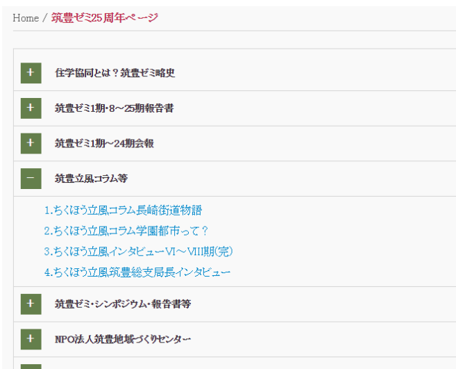
図 1. 筑豊ゼミ 25 周年記念ページ

先月作成した筑豊ゼミ 25 周年ページに関してプロトタイプデザイン・構造を確定し、完成しました。(図 1)