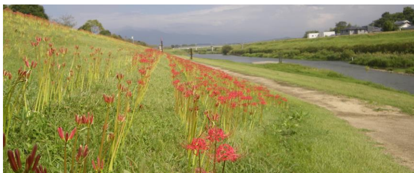
筑豊初秋の風景(1) 2015年9月17日 宮若市犬鳴川河川公園 彼岸花

「卑弥呼祭り」については、音楽会やグルメ、神楽などの話ができました。今回は出席者も4人と少なく、企画の進捗も悪いため、少し早目の閉会となりました。