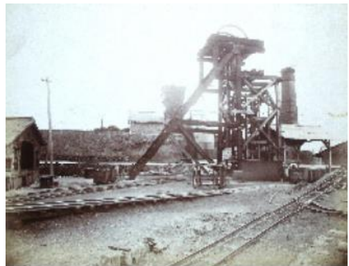
明治32年(1899)頃の潤野炭坑

http://www.city.iizuka.lg.jp/rekishi/hirooka27.pdf